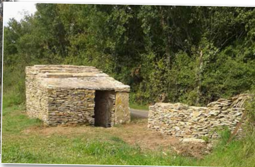
Après restauration

Le village perché de Saint-Clément-sur-Guye, situé au centre du département de Saône-et-Loire, aux confins du Charolais, du Clunisois et de la Côte chalonnaise bénéficie d'un riche patrimoine avec ses deux menhirs, son cimetière mérovingien, son église romane, l'une des plus anciennes du département, son château de l'Effondrée, ses deux anciens moulins à vent et un habitat rural relativement bien préservé. Sur la colline de Saint-Clément, qui constitue l'extrémité sud-ouest de la Côte chalonnaise, ont été également recensées, dès la fin des années 1970, plus d'une quarantaine d'anciennes cabanes en pierre sèche dites cadoles (1) .