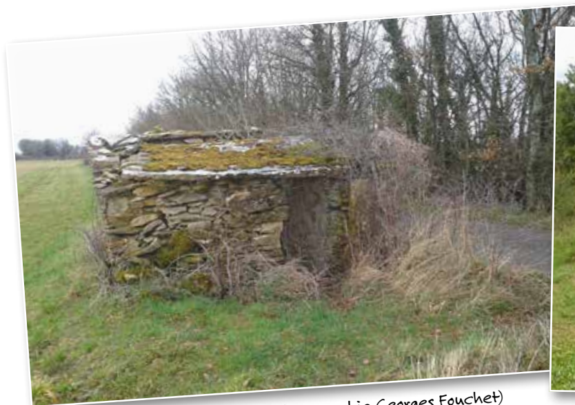
Avant restauration